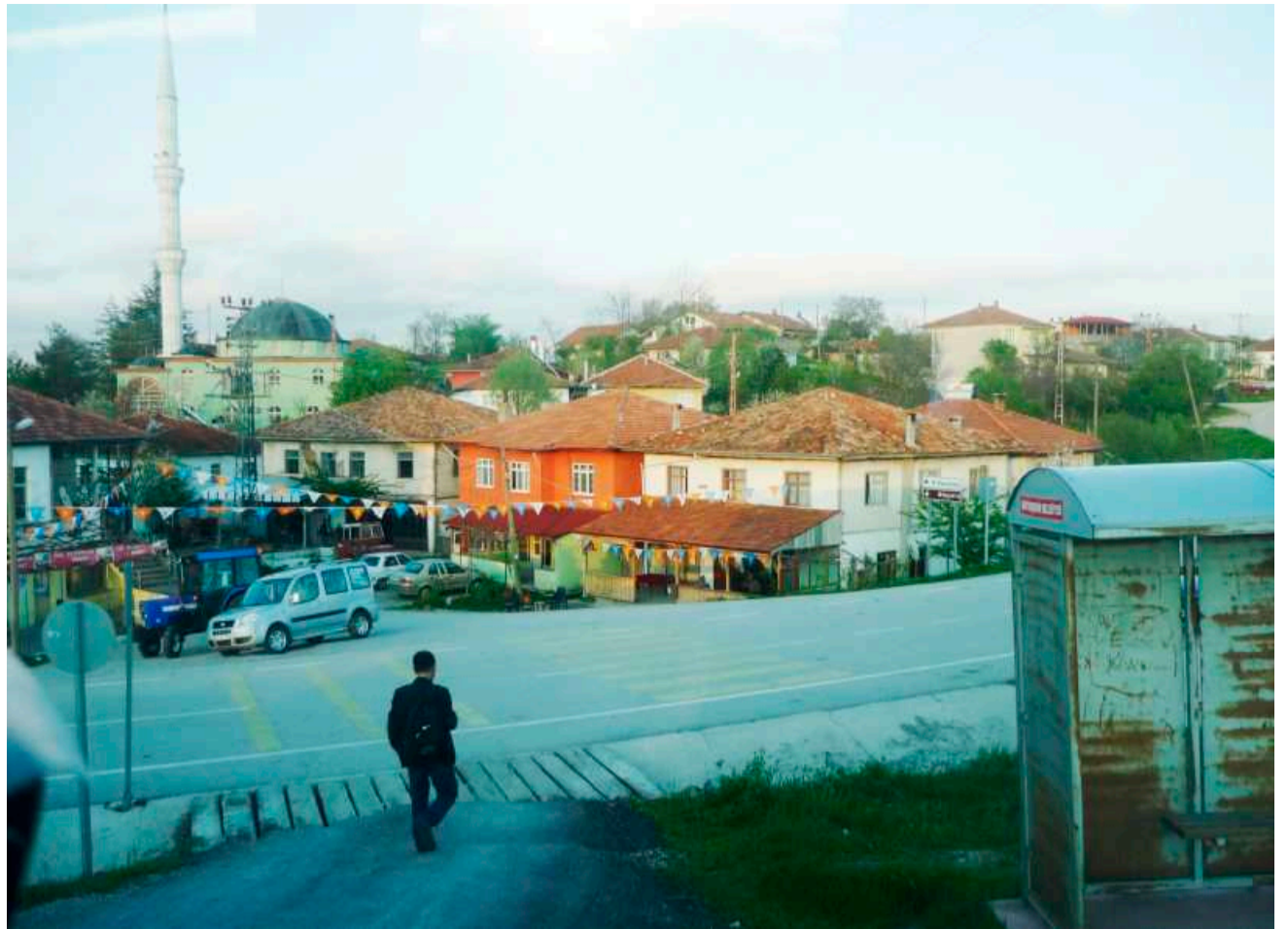
Το χωριό Αλατσάμ στην Πάφρα του Πόντου όπως είναι σήμερα

Δεκαπέντε μέρες μετά φτάσαμε στα προάστια της πόλης Ποϊβάτ (Poivat). Μέχρι τώρα πέθαναν περισσότεροι από τριακόσιοι άνθρωποι. Ο ηλικιωμένος άνδρας που με φιλοξένησε μαζί με το νεότερο εγγόνι του ήταν μέσα σε αυτούς τους ανθρώπους. Την στέγη μας αποτελούσε ένα υπόστεγο που χωρούσε μόλις εκατό περίπου ανθρώπους και οι υπόλοιποι βρίσκονταν έξω. Κατά τη σύντομη παραμονή μας στην