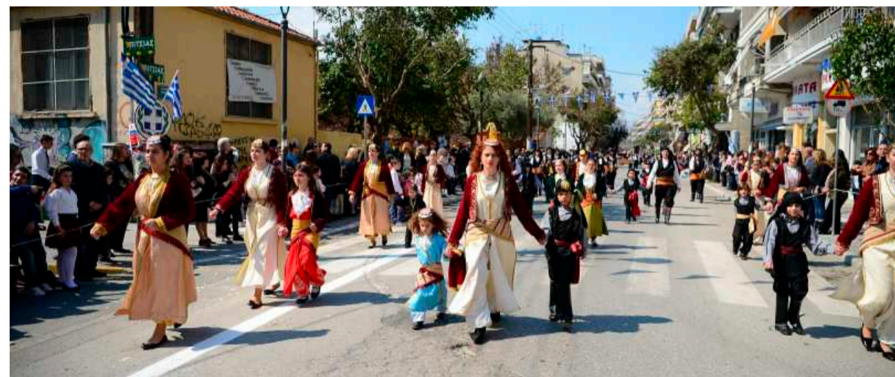
Από την παρέλαση στην Κατερίνη