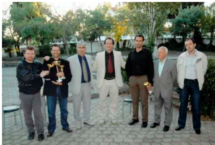
Στην πλατεία του χωριού μετά τον τελικό του τουρνουά σκακιού στην υπαίθρια σκακιέρα