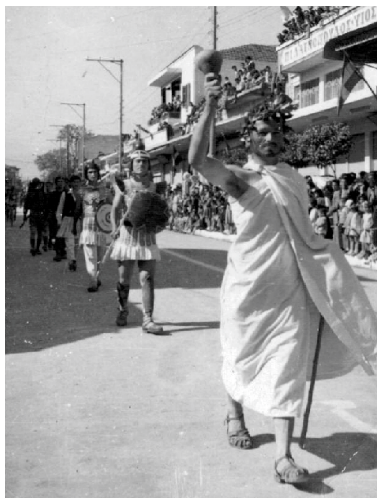
Παρέλαση στην Κατερίνη το 1961

του χωριού μας με απaráμιλλο ζήλο και αφοσίωση.